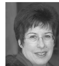
ジュリー・カウフマン氏

内 容 : ベッリーニ: ああ信じられない(歌劇《夢遊病の女》より) モーツァルト: コンサートアリア《あなたに明かしたい、おお神よ!》K.418 ヴェルディ: 慕わしい方の名は(歌劇《リゴレット》より)