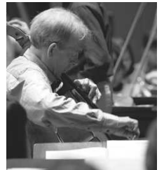
ハンス＝クリスティアン・シュヴァイカー氏