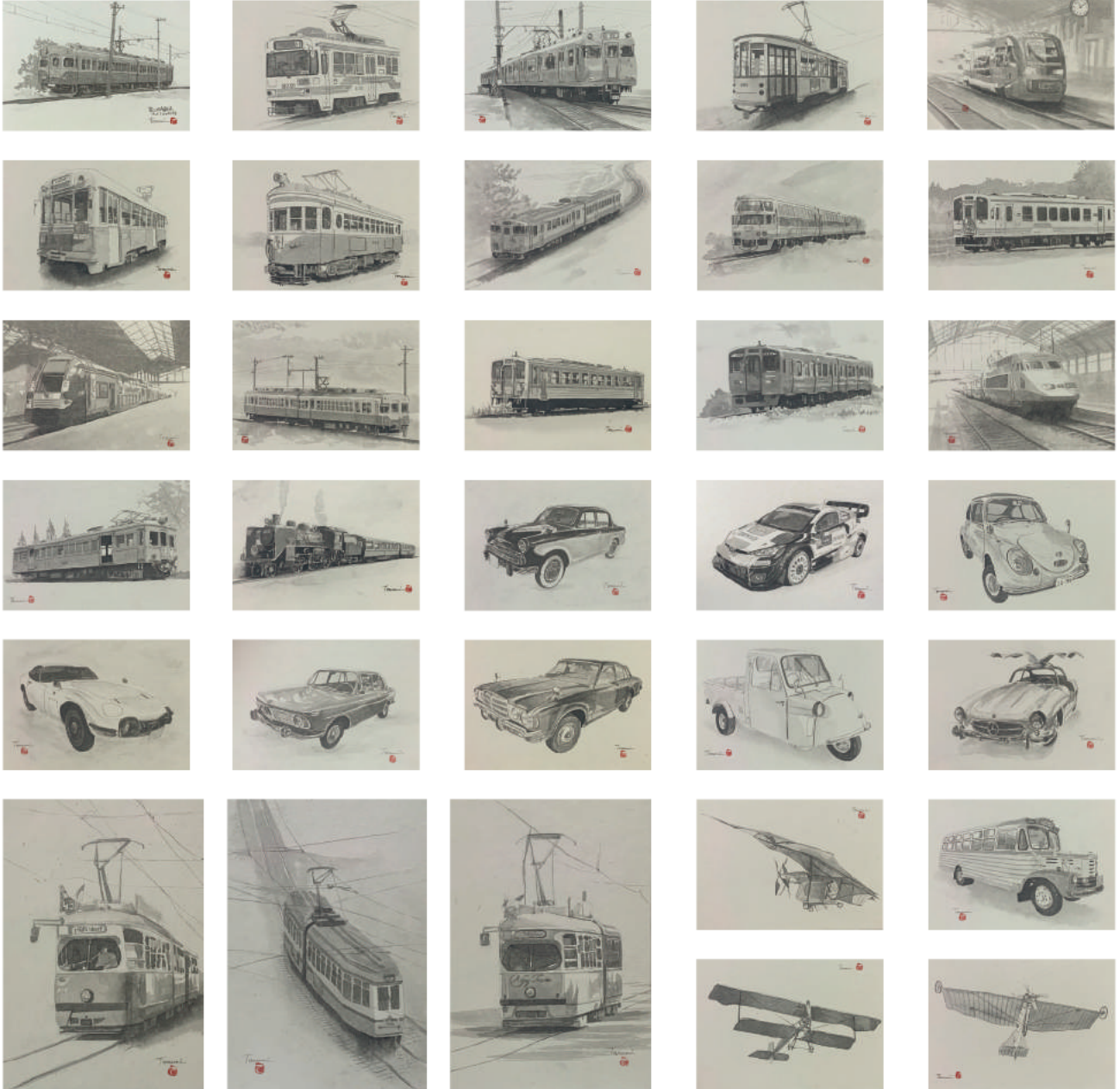
*作品はすべて SM サイズ (15.8×22.7cm) 税込 165,000円 (額代別途)