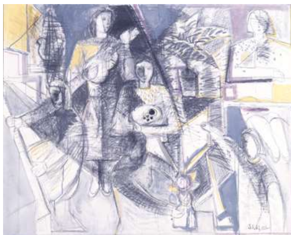
島田章三《かたちびと 89》1989

本展覧会は、現在開催中の「コレクション展 1 ひとのかたち—写実—」（2023年5月28日まで開催中）に続き、抽象的な表現や色を支柱に感情や内面、精神性をあらわした人物表現をご紹介します。「写実」では、作家それぞれが思い描く本物らしさを「写実」表現として紹介してきました。今回のテーマである「抽象」は、変形や歪曲、情動などによって強調された対象の造形要素の可能性を追求するものです。