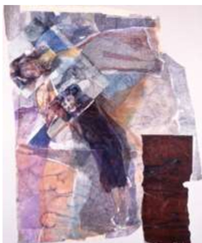
杉山健司《ヒトたち》1989