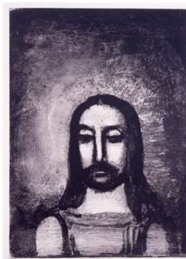
ジョルジュ・ルオー 《ボードレール『悪の華』》1927