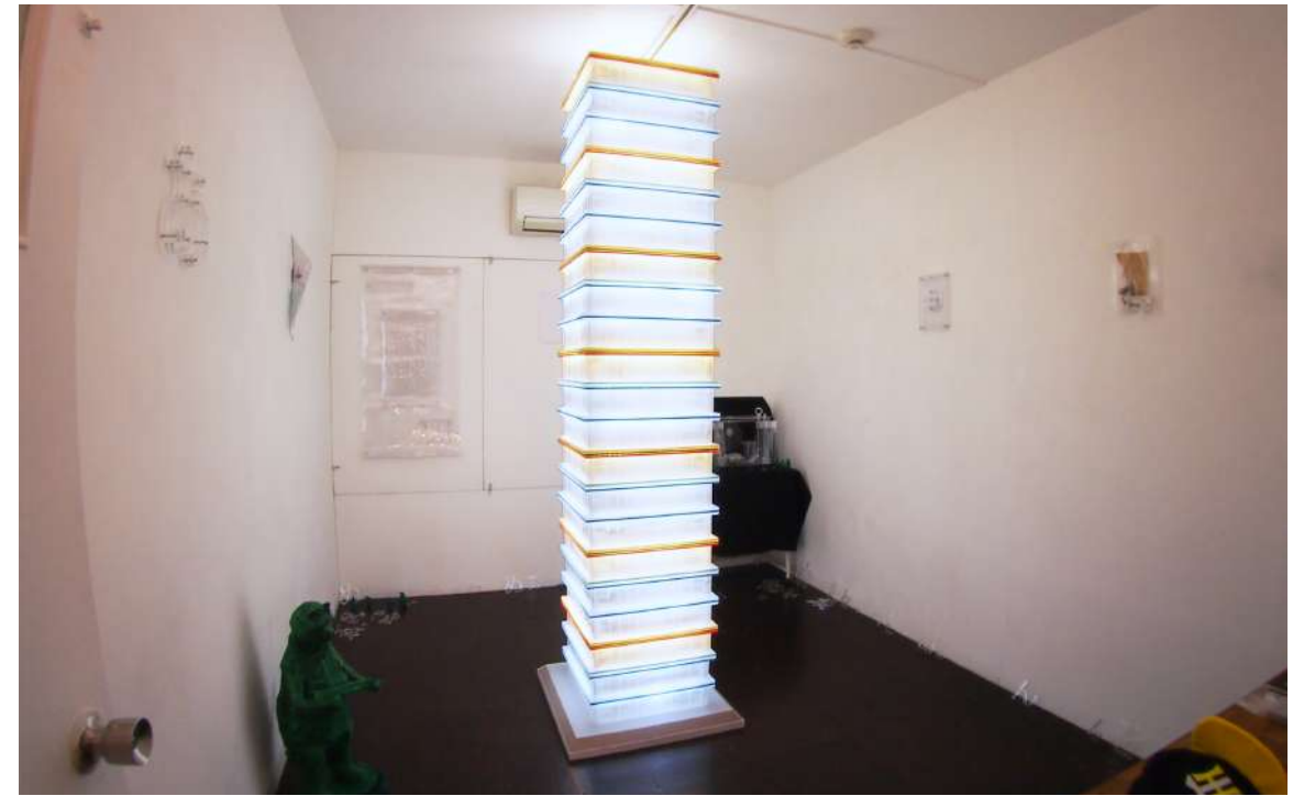
＜テレパシー英会話教室＞ 事業名:テレパシー英会話教室 報告者:谷崎 壮太郎(美術研究科博士前期課程 彫刻領域)

令和元年12月5日～11日にDESIGN FESTA GALLERY 原宿にて谷崎壮太郎と木村友南による2人展、「テレパシー英会話教室」を開催しました。