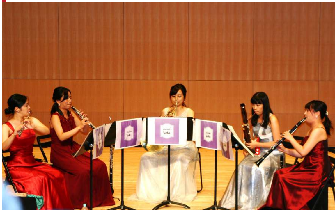
あいちアール・ブリュット2019におけるコンサートの開催

昨年9月12日に「愛知県立芸術大学フレッシュアーティストによる木管五重奏の午後」を、翌13日に「愛知県立芸術大学フレッシュアーティストによる弦楽とピアノの夕べ」を名古屋市東文化小劇場で開きました。これは「あいちアール・ブリュット障害者アーツ展」の企画として、愛知県と愛知県立芸術大学の共催で行われたもので、コンサートを実施するにあたって愛芸アシスト基金を活用させていただきました。